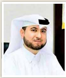
د. خالد القررة داغي

غير تقليدية كإحصاءات التجارة الخارجية وبيانات مجموعة شاملة من الخرائط لدولة قطر، كما يمكن استخدامه في أي وقت من الاتصال والتواصل مباشرة بجهاز التخطيط والإحصاء عند وجود استفسار أو طلب بيانات، ويقدم خدمة إرسال التنبيهات للمستخدمين عند التحديث على البيانات أو صدور بيانات جديدة وهذا ما يجعل التطبيق تفاعلياً من عدة جوانب ولجميع فئات المجتمع ومؤسسات دولة قطر.